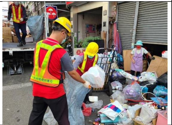
北屯西區清潔隊執行關懷計畫業務