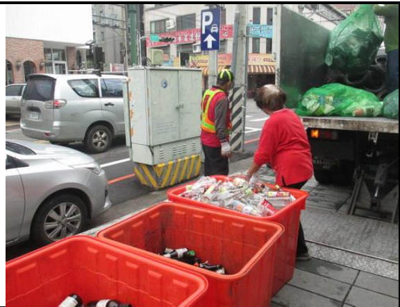
大里區清潔隊執行關懷計畫業務