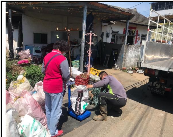
新社區清潔隊執行關懷計畫業務