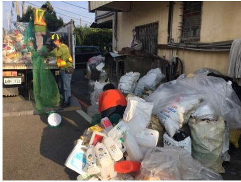
石岡區清潔隊執行關懷計畫業務