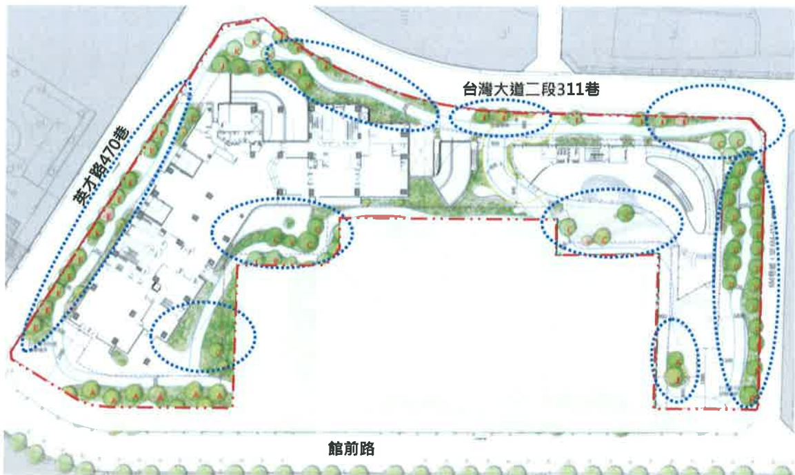
圖 5.2.3-1 本次備查基地喬木植栽示意圖