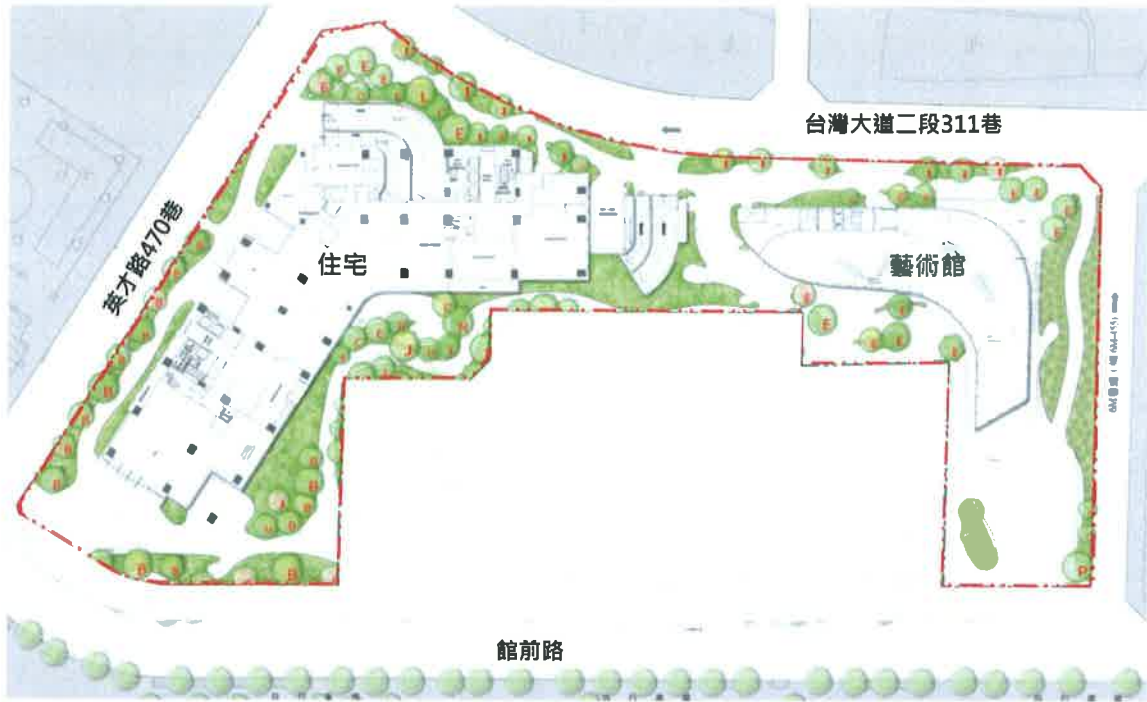
圖 5.2.3-1 原基地喬木植栽示意圖