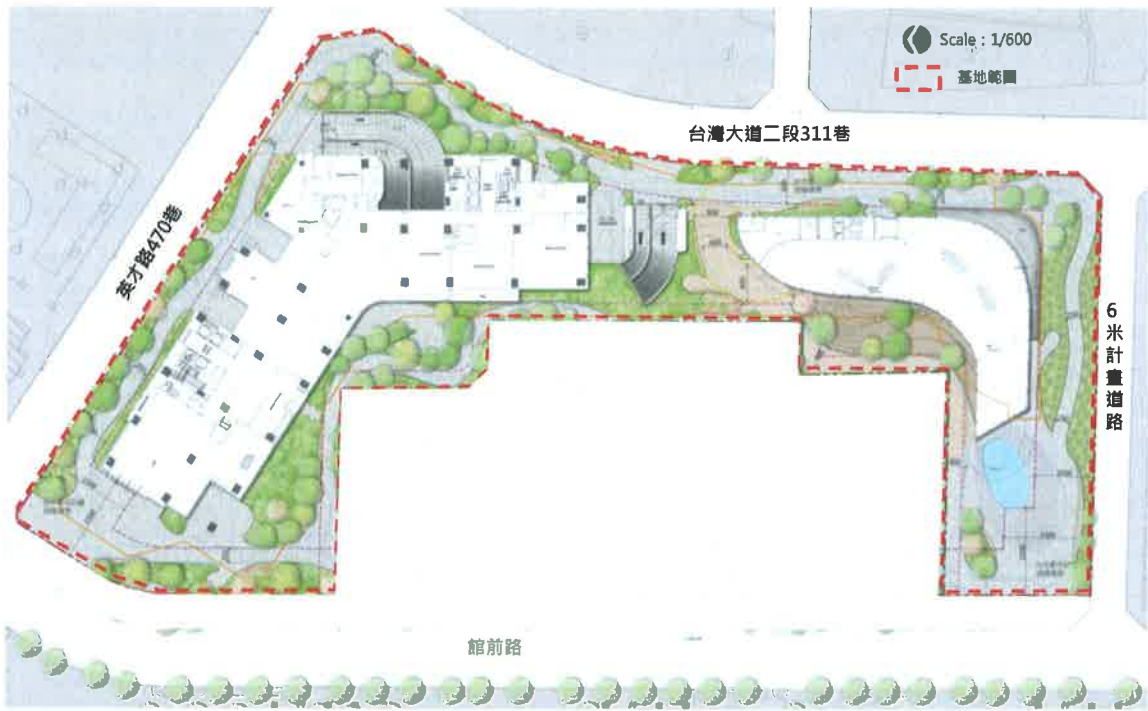
圖 5.2.1-1 原平面配置示意圖