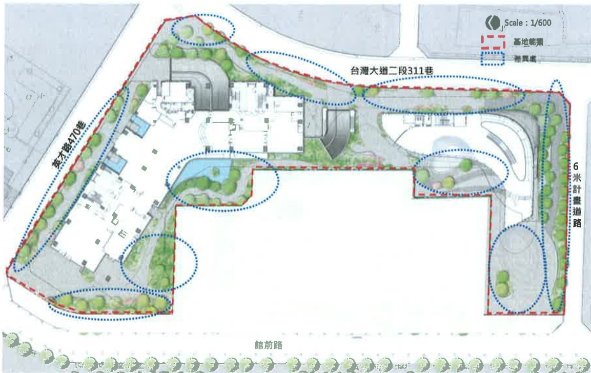
圖 5.2.1-1 本次備查平面配置示意圖